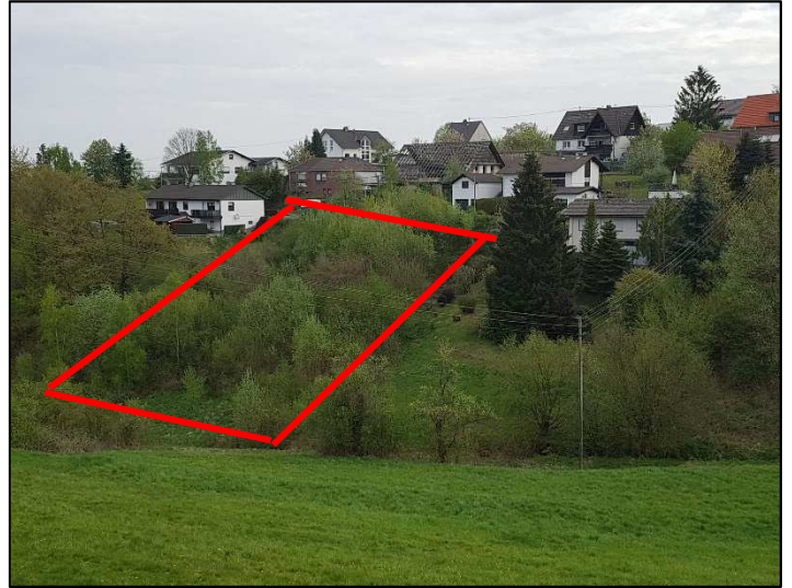
Lage des Flurstücks (schematisch)