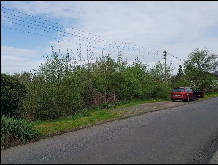
Ansicht von der Hangstraße Richtung Nordwest